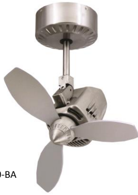
Model : SWING 110-BA