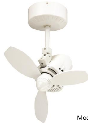
Model : SWING 110-WH