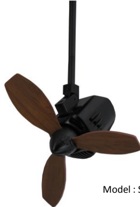
Model : SWING 110-MB